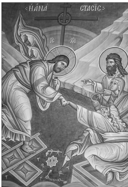
Сошествие во ад. Фреска Успенского храма.

в этих работах современные мастера воплощают древние традиции церковного искусства.