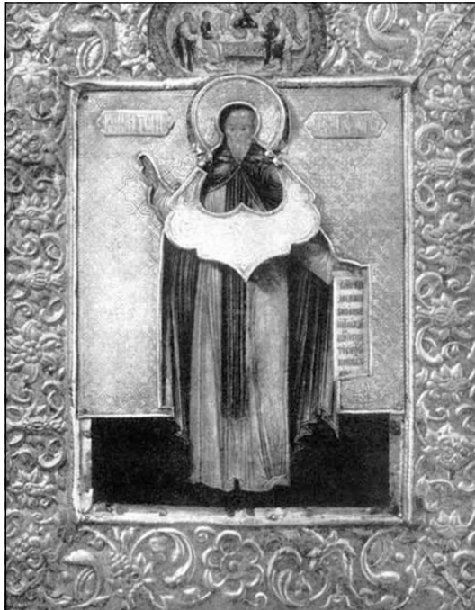
Прп. Антоний Сийский. 1667 г. Из собр. П. Корина.

Б ыл и другой боярин Василий, по прозванию Воронцов, наместником на Двине, у слуги же его Самойлы случилась болезнь падучая от лютого беса, так что испускал он вопли ужасные, как вол ревел и зубами скрежетал, пену испуская из уст своих. Насильно привели его в монастырь в узах железных, по совершении же молебна Преподобный приложил бесноватого к чудотворному образу, и в тот же час исцелился он от недуга своего и осмысленно стал говорить. Дал исцеленный Самуил обет Живоначальной Троице постричься в обители преподобного Антония и отошел в дом свой, радуясь и Бога славя. После преставления же Антония исполнил обет