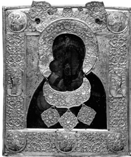
Владимирская икона Божией Матери. Дар Сийскому монастырю Патриарха Филарета. 1628 г.

шое с финифтами на александрийской бумаге, печати московской, выхода 7190 (1682) года, положено боярином Иоанном Михайловичем Милославским.