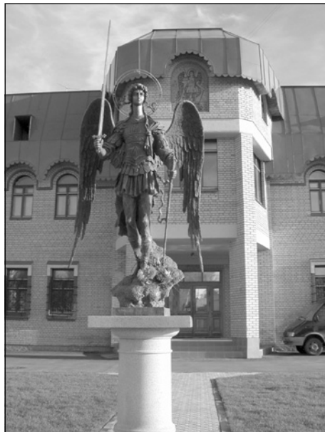
Архангел Михаил — небесный покровитель города.

За десять дней следования миссионерского поезда по территории Архангельской области было совершено 9