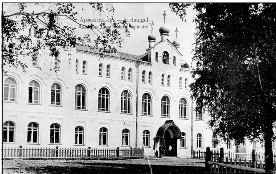
Архангельская духовная семинария. Начало XX в.

Сразу после победы советской власти в Архангельске начались репрессии против духовенства. В феврале 1920 г. органами ВЧК был разгромлен архангельский Союз духовенства и мирян, созданный по решению общеепархиального съезда духовенства в 1917 году, который был лоялен Временному правительству Севера России. Были арестованы десятки людей, среди которых временно управлявший Архангельской епархией с 1919 г. епископ Пинежский Павел (Павловский), редактор Архангельских Епархиальных Ведомостей Иоанн Попов, секретарь