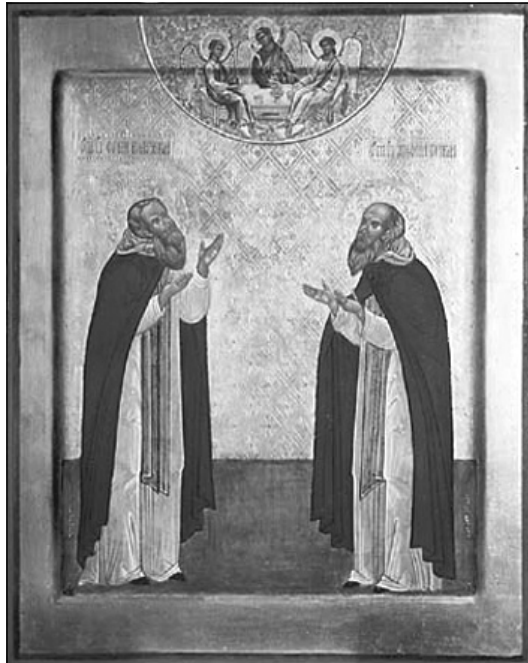
Прпп. Сергей Радонежский и Антоний Сийский. 1994 г.

Был же он от мира вдалеке, в диком лесу посреди озер, за семь с лишним верст от ближайшего поселения мирс-