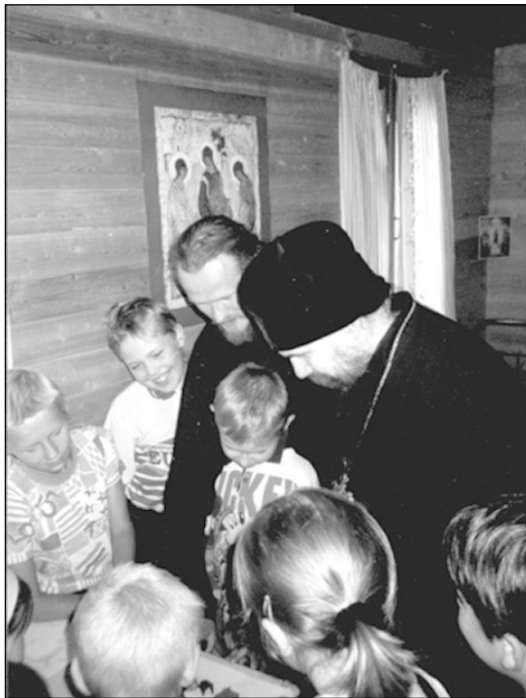
Летний лагерь отдыха детей в Сийском монастыре. 1997 г.

Мало того, что Церковь определилась, она готова активно действовать