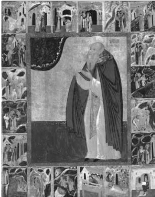
Прп. Антоний Сийский. Икона XVII в.

его, о державе царства его, о христоролюбивом воинстве и всем православном христианстве. С радостью вернулись старцы в монастырь и прочитали жалованную грамоту на соборе монастырском, после чего помолились преподобный Антоний с братиею о здоровье государя и дарованиях ему наследников, возглашая: «Бог да умножит царство самодержавного государя и подаст чреву его плод чадородия». Называл же Преподобный братии со-